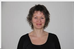
VIA University College