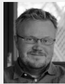
Nordik bağlamında kariyer öğrenme